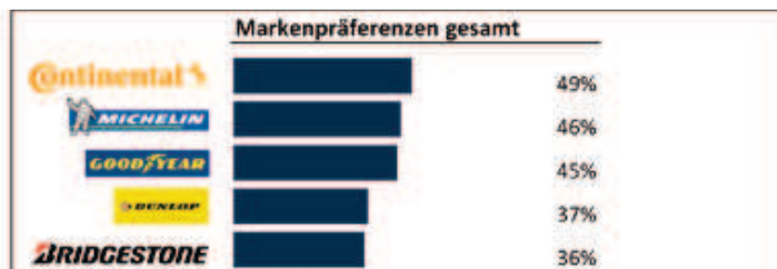
Chart 1 – Investitionen in Markenaufbau tragen Früchte: Die Bekanntheit der führenden Premium-Reifenmarken ist relativ hoch. Allerdings liegt die Kaufpräferenz deutlich niedriger.