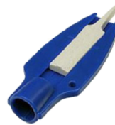
Reifenprofilprüfer mit Ventilkappendreher