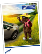
Notizblock (DIN A5)